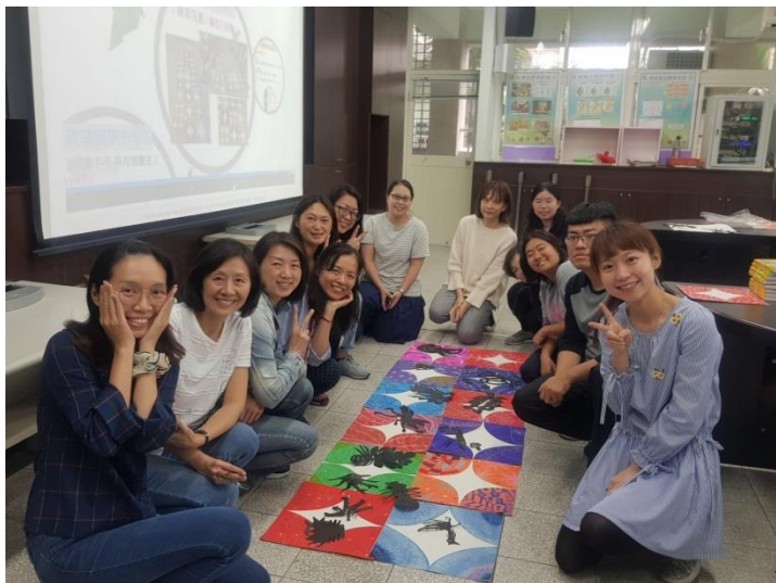
教師工作坊研習—兒童畫應用於集體創作