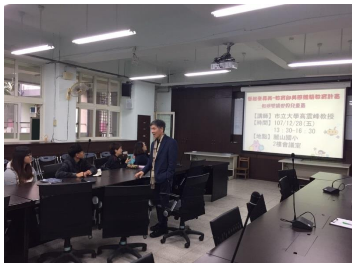
教師講座研習—如何閱讀世界兒童畫