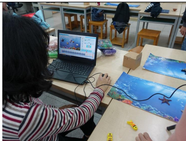
教師工作坊研習—動畫製作