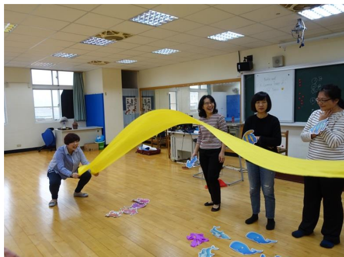
教師工作坊研習—身體百寶箱(音樂與表演藝術)