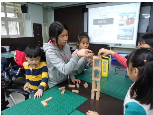
積木疊疊樂—蓋出最高的建築