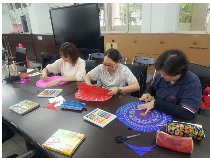
教師工作坊研習—兒童畫應用於集體創作