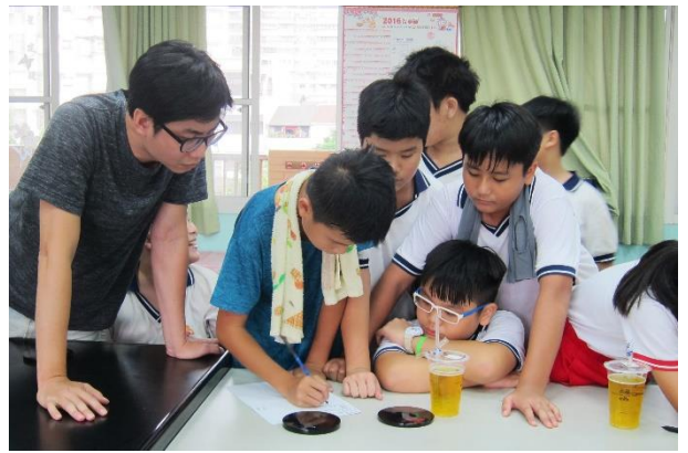
分組討論—選出小組喜歡的作品，並發表其創作理念及感想