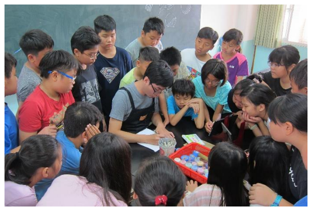
講師邊解說、邊示範技法