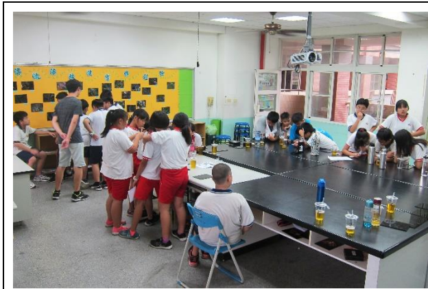
走動教室觀察學生分組討論情況，如有問題馬上討論