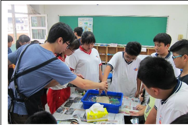
協助學生技法體驗操作