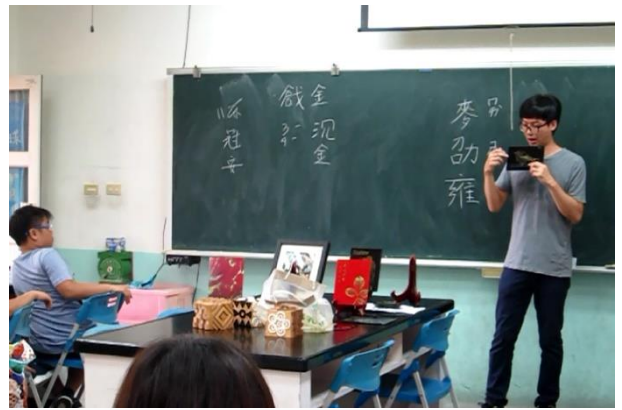
漆藝技法運用講解