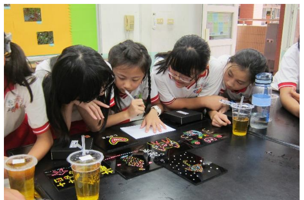
分組討論—選出小組喜歡的作品，並發表其創作理念及感想