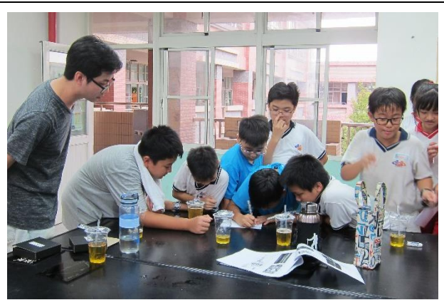
分組討論—選出小組喜歡的作品，並發表其創作理念及感想