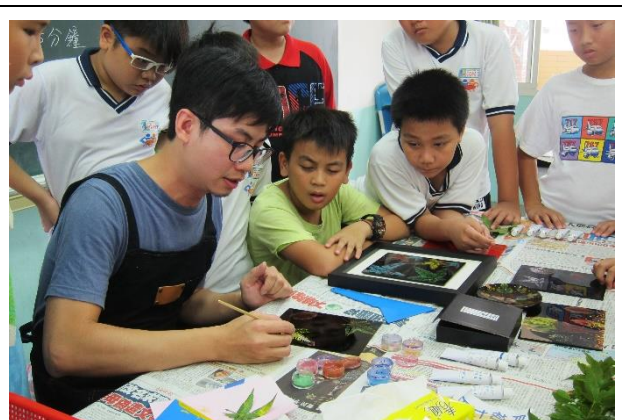
講師邊解說、邊示範技法