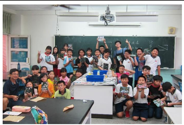
第一次快樂有趣的實作體驗合影