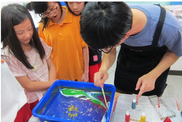
講師解說漂流漆技法(邊解說、邊示範)