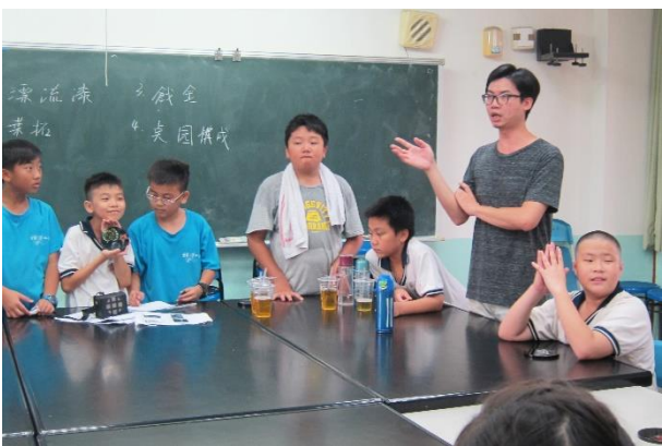
講師在旁給予適當協助分享、補充