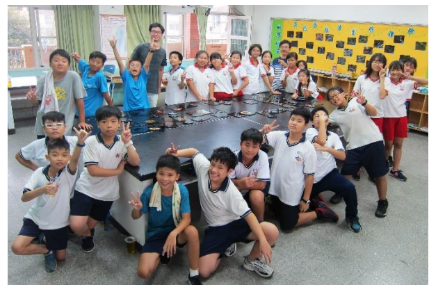
文化體驗內容課程結束，總合影