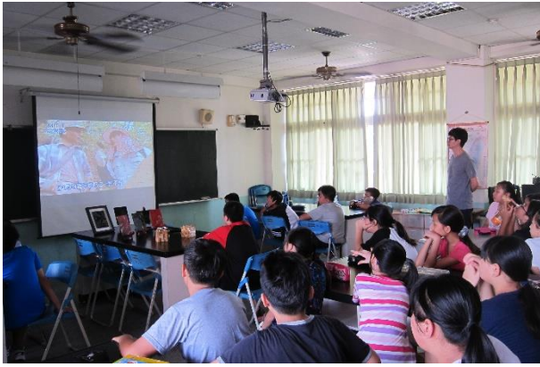
短片介紹台灣漆藝環境