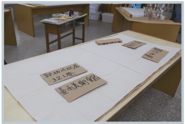
[ 自然教室 ]