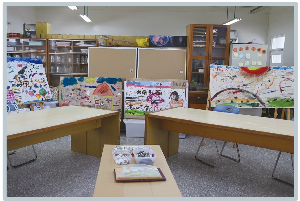
( 自然教室 )