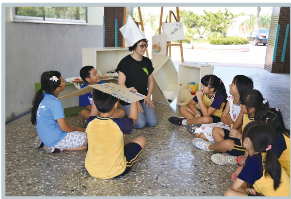
( 大門通道 )