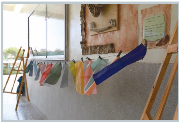
[ 大門通道 ]