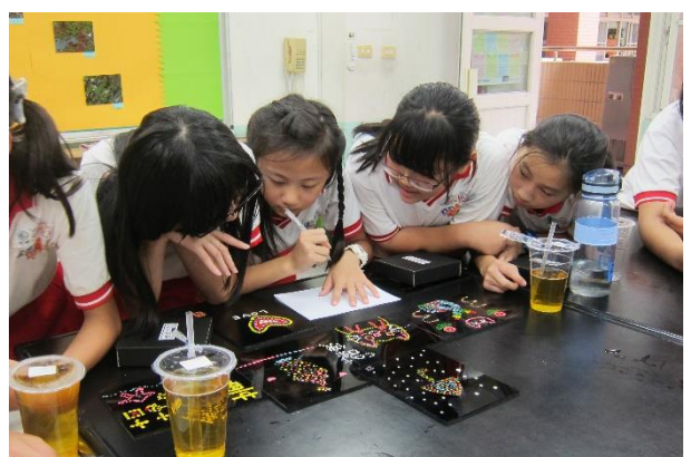
分組討論—選出小組喜歡的作品，並發表其創作理念及感想