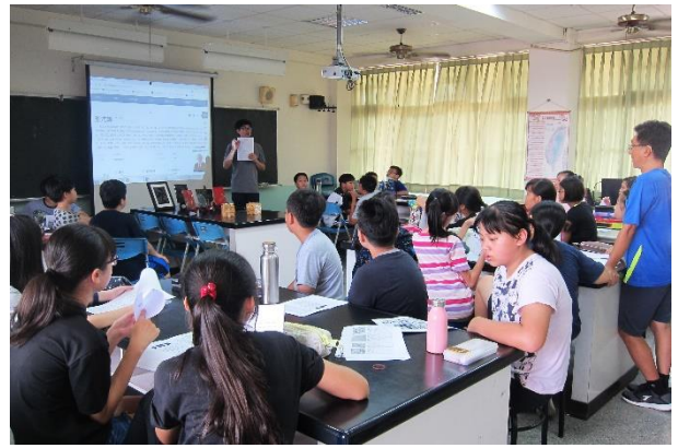
PPT 講解－帶入造型原理、色彩運用及藝術概論