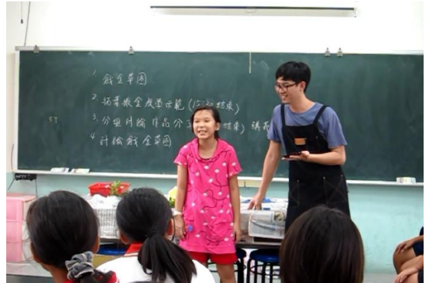
大家互相觀摩作品並心得討論