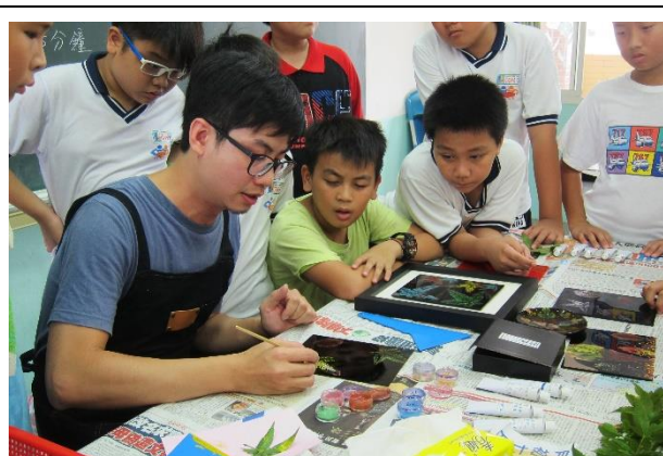
講師邊解說、邊示範技法