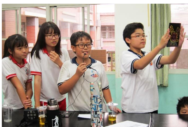
讓學生體驗發表創作作品，提升學童的表達能力及自信心。