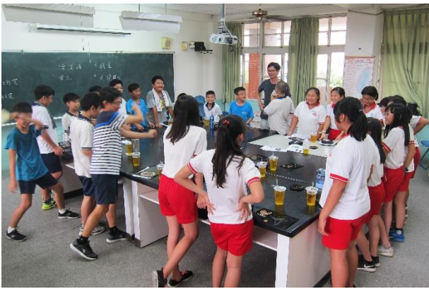
帶領學生發表作品理念，說明遊戲規則