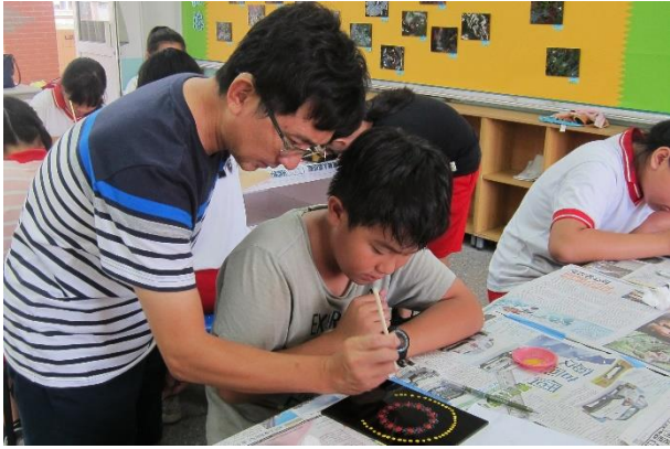
班導師協助技法操作講解