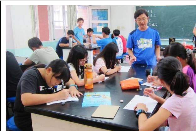
班導師協助技法操作講解