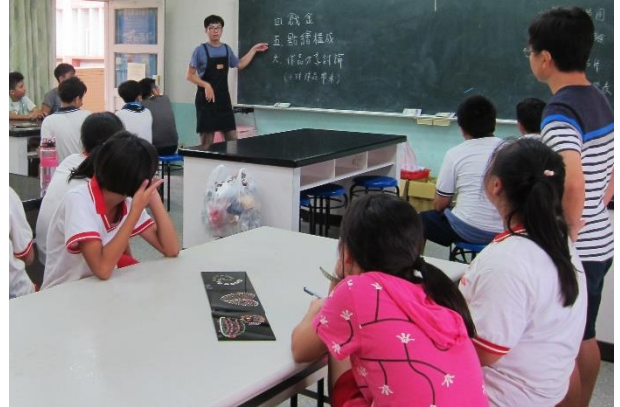
實作體驗後，作品討論，加強學生體驗印象及技法細節