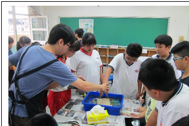
協助學生技法體驗操作