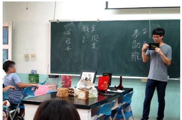
漆藝技法運用講解