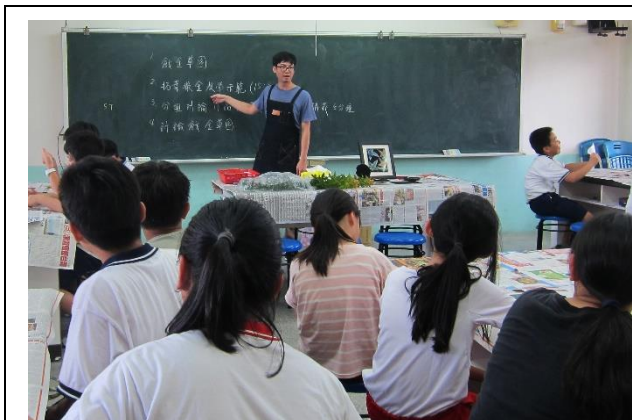
講解上課體驗內容