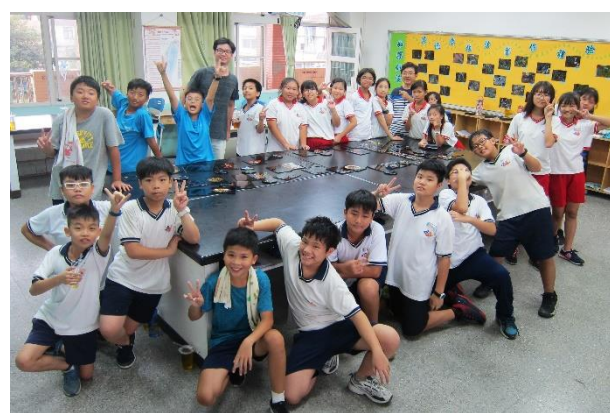
文化體驗內容課程結束，總合影