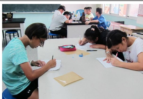
學生們親自實作體驗