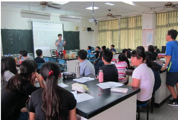
分享講師及網路上漆藝作品