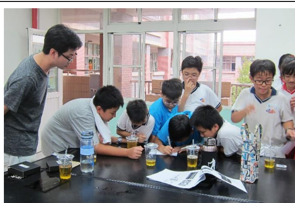
分組討論—選出小組喜歡的作品，並發表其創作理念及感想