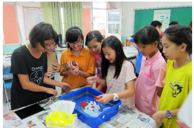
學生們親自實作體驗