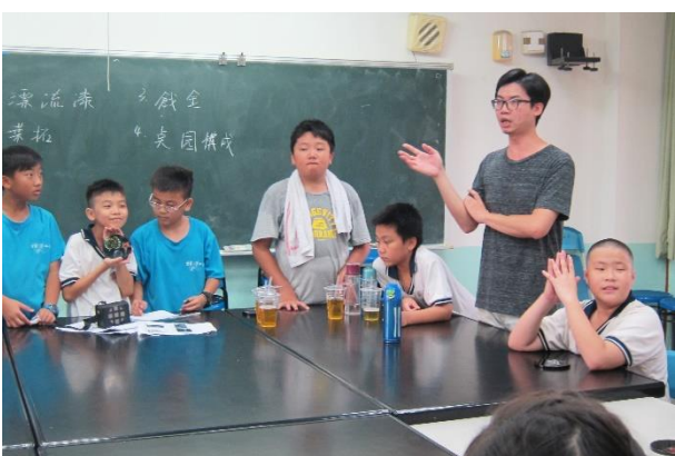
講師在旁給予適當協助分享、補充