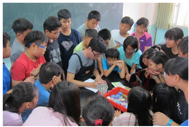
講師邊解說、邊示範技法