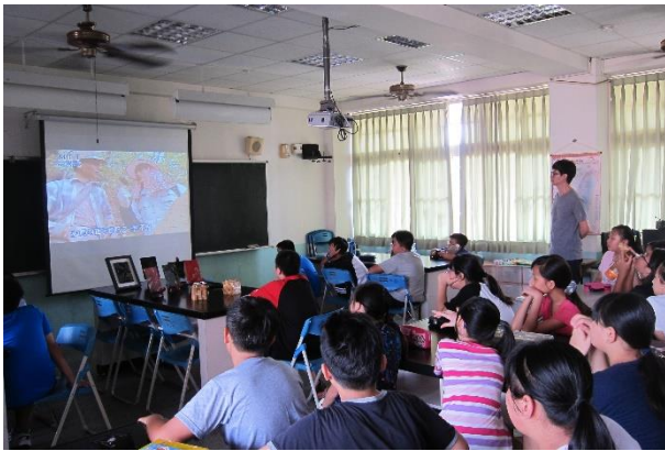
短片介紹台灣漆藝環境