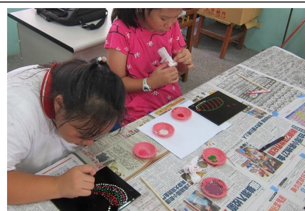
學生們親自實作體驗