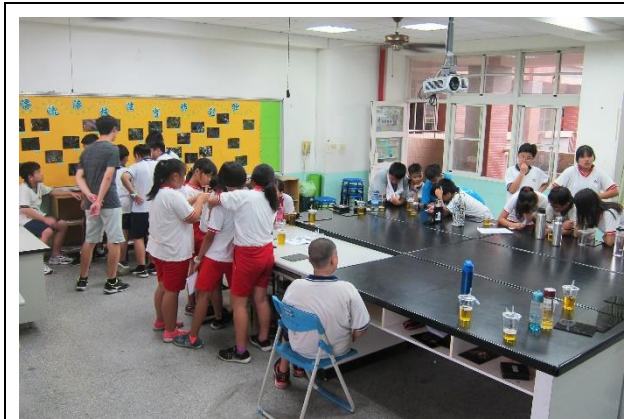
走動教室觀察學生分組討論情況，如有問題馬上討論