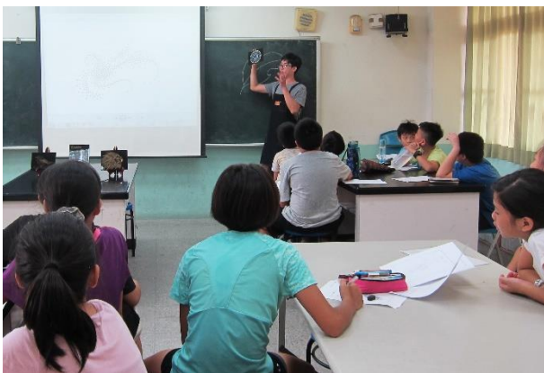
講解下次上課內容，請學生回家先準備草圖