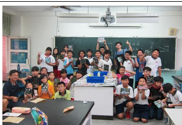
第一次快樂有趣的實作體驗合影