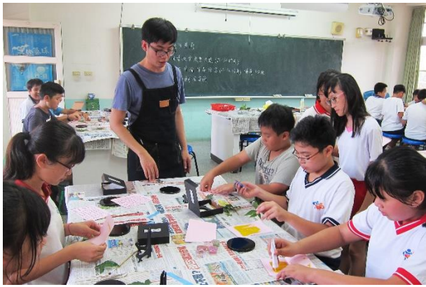
分組體驗、帶著學生邊解說邊操做，問題發生立即討論