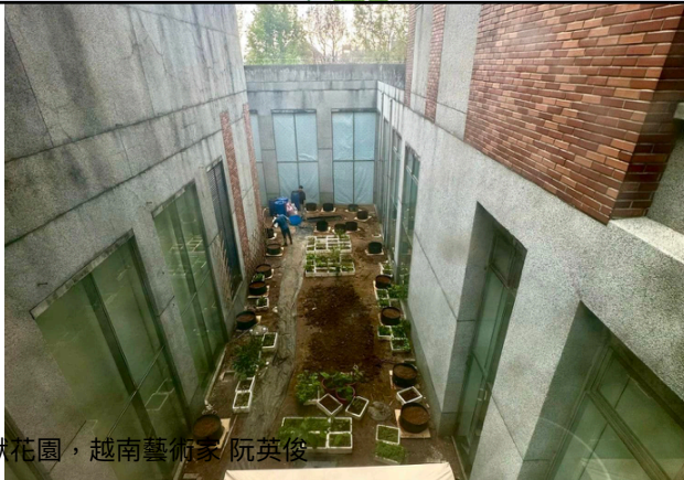
圖1-2 / 關渡美術館 靜默花園，越南藝術家 阮英俊