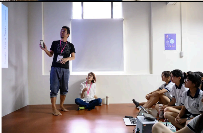
圖2-2 / 藝術家短講