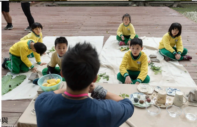
圖1-2 / 體驗及創作參與