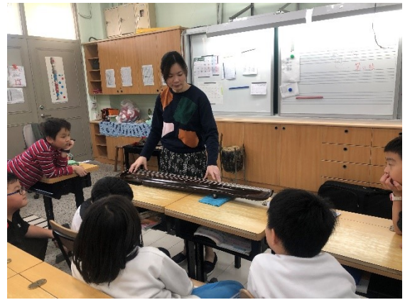
介紹古琴外觀、歷史小故事