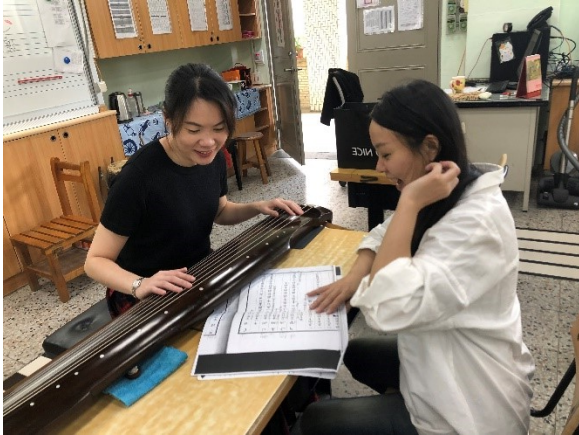
老師學習研究文字譜