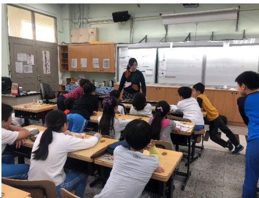
介紹古琴演奏方式