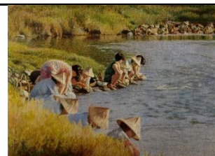
三峽河邊洗衣情景