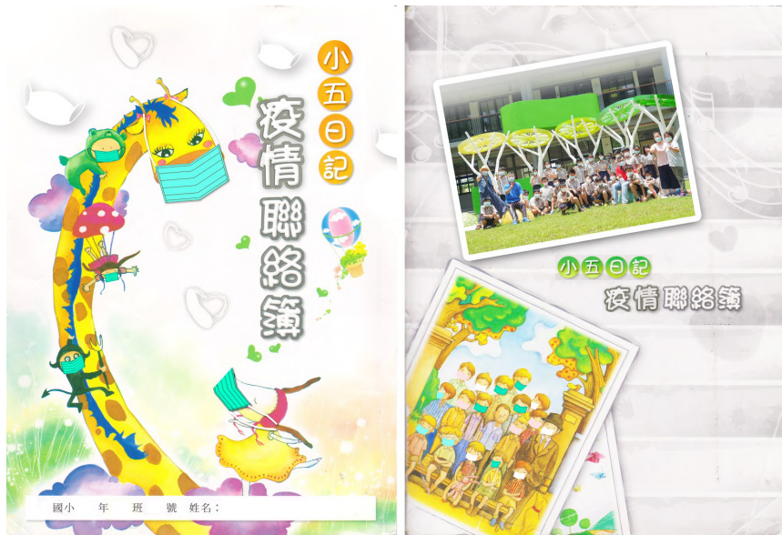
疫情聯絡簿 封面封底