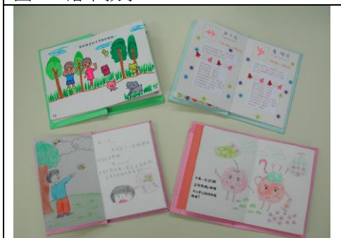
圖 4：學生繪本小書作品