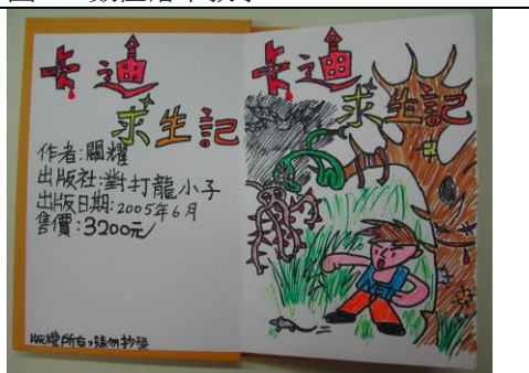
圖 5：學生繪本小書作品