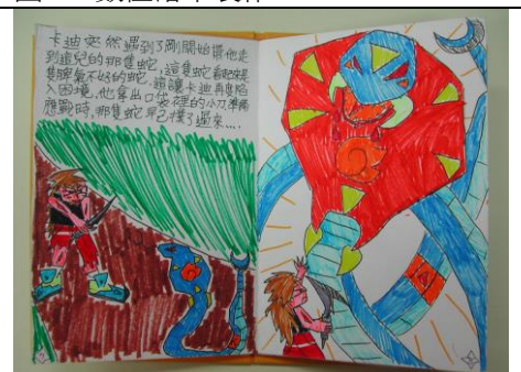
圖 6：學生繪本小書作品