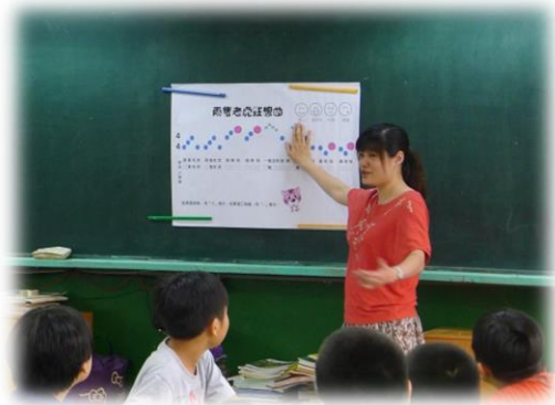
♪發現不同的兩隻老虎